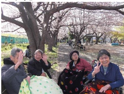
桜のトンネルきれいでした。