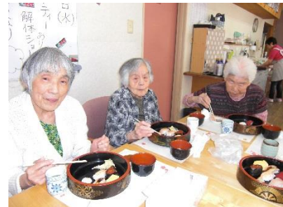
今年が一番人気はエビでした