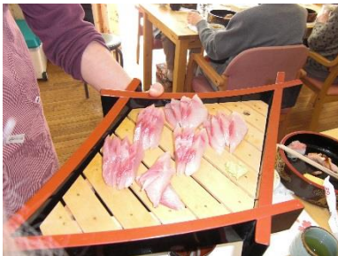
目の前でわらさを解体してお刺身にして下さいました