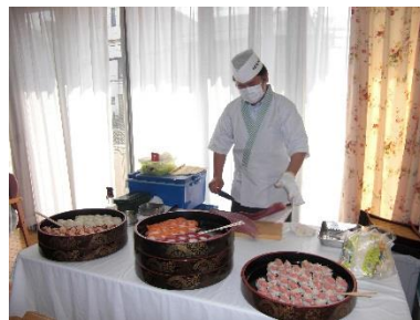
毎年恒例の出張お寿司！