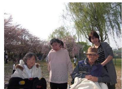
今年はずっとより早く桜が満開になりました。