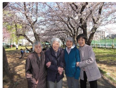
今年はとらやの羊羹を皆さんで頂きました。