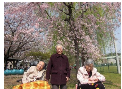
快晴でお花見日和でした。