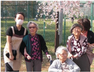
春の風に吹かれて楽しいお花見