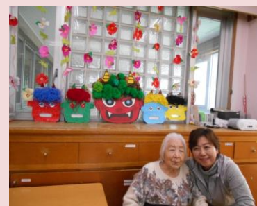
表情豊かな、手作り鬼