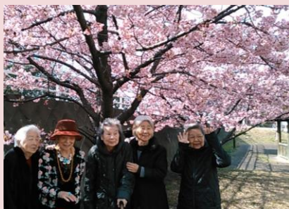
河津桜を見に行きました。