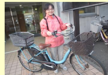
ご自宅に「行ってきます。」